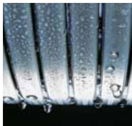
De Inox-Radial-warmtewisselaar uit roestvast staal garandeert een maximale efficiëntie en lange gebruiksduur

Wereldwijd de meest verkochte HR oliecondensatieketel: beproefde Viessmann techniek voor nieuwbouw en renovatie.