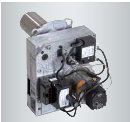
Vitoflame 300 unit blauwevlambrander op stookolie voor bijzonder schone, milieuvriendelijke verbranding